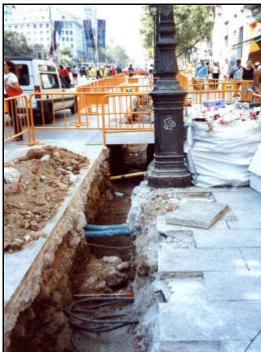
Foto 15: Tram de la Rasa 2 on han aparegut (al fons) el mur UE 205, el paviment de terra batuda, UE 206 i el paviment de rajoles, UE 207 i (en primer pla) el mur UE 208.