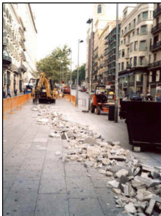
Foto 2: Inici de l'excavació de la Rasa 1. Repicat del paviment, UE 100.