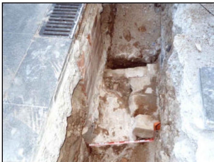
Foto 21: Detall de la claveguera UE 215 i els murs que se li adossen, la UE 217, el mur més antic (dreta de la foto) i la UE 218, el mur més modern que talla la UE 217 (esquerra de la foto).