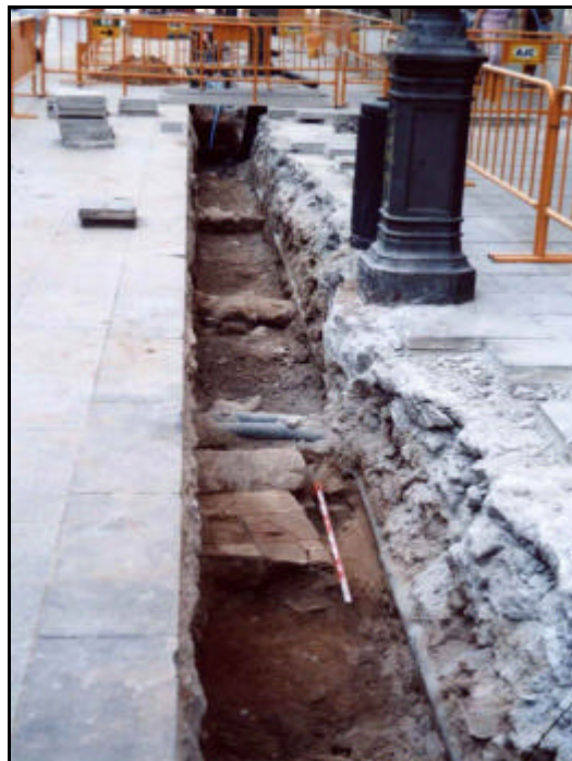
Foto 25: Vista general de la Rasa 2. En primer terme detall del paviment UE 220 i la llosa que li fa de límit, UE 223. Darrera seu es veu el mur UE 219 i al fons la claveguera i els murs adossats.