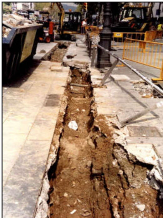
Foto 37: Vista general de l'obertura del tercer tram de la Rasa 2, situat a tocar del C/ Fontanella i davant l'edifici de telefònica.