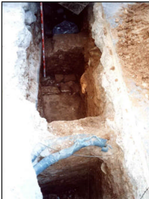
Foto 19: Tram de la Rasa 2 on ha aparegut (en primer pla i mirant en direcció a mar) el mur UE 209, el paviment UE 211, el mur UE 212 i el mur UE 213.