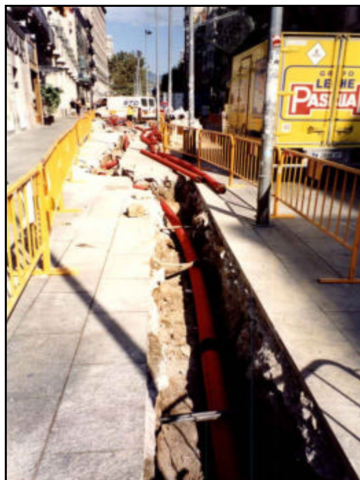
Foto 10: Estesa dels serveis d'electricitat, una vegada excavada la rasa, a l'altura del "Cine Paris".