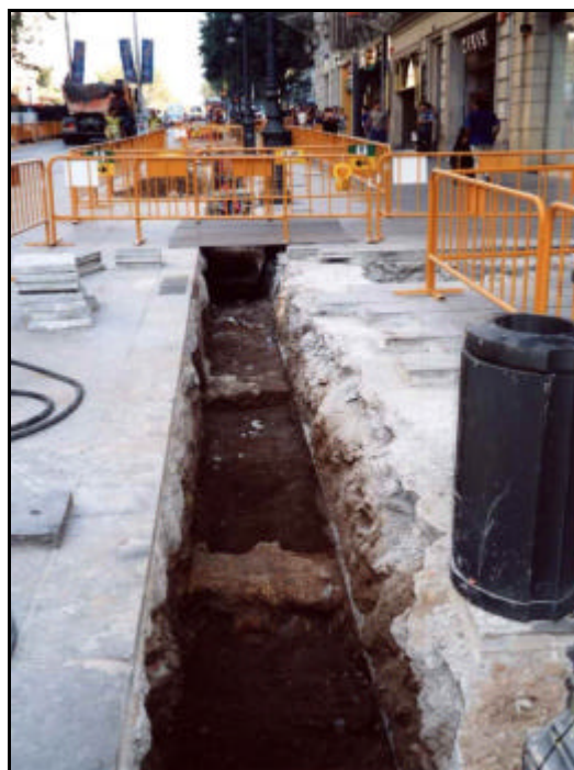
Foto 22: Vista general de la Rasa 2. En primer terme detall del mur UE 219. Just darrera seu es situa la claveguera, UE 215 i els murs adossats, UE 217 i UE 218.