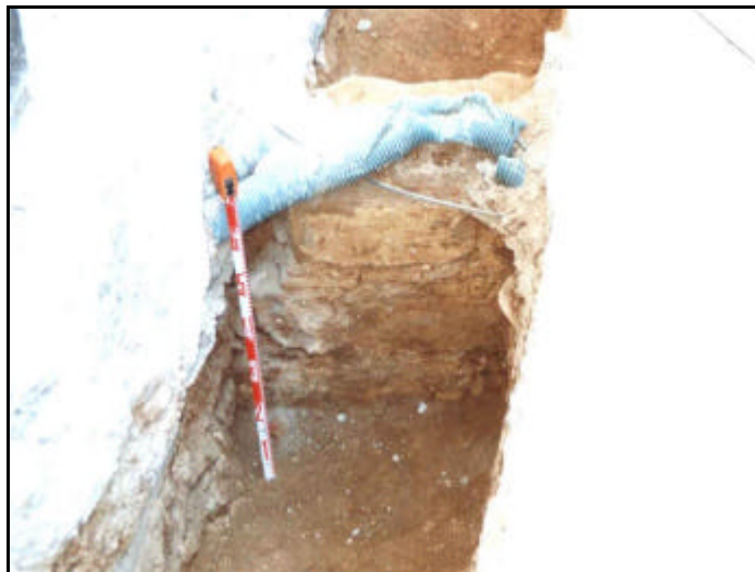
Foto 17: Detall frontal del mur UE 209, amb les restes d'estuc i pintura de color ocre, UE 210.