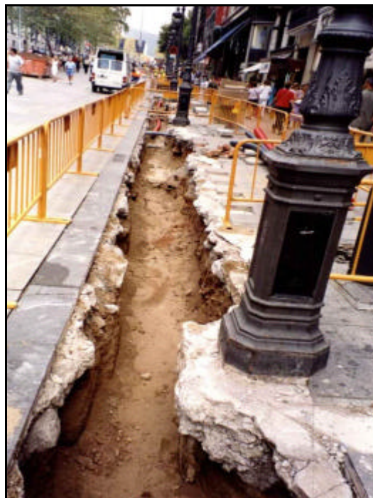
Foto 36: Vista general del segon tram de la Rasa 2, durant una vegada finalitzada l'excavació de la rasa.