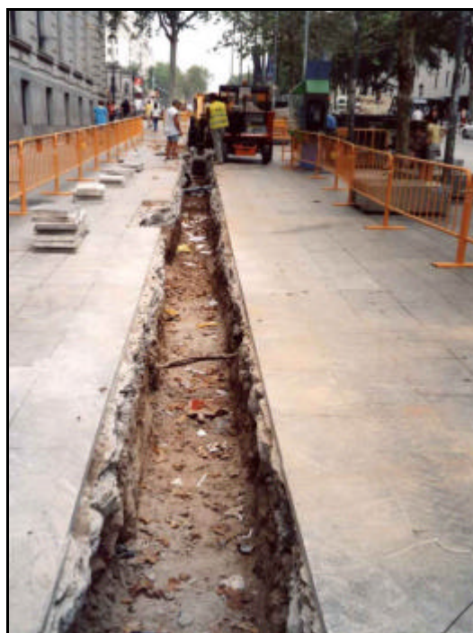
Foto 6: Excavació de la Rasa 1 en el tercer tram situat davant de l'edifici del “Banco de España” fins arribar al final de l'Avinguda del Portal de l'Àngel, a l'altura de la Plaça Catalunya.