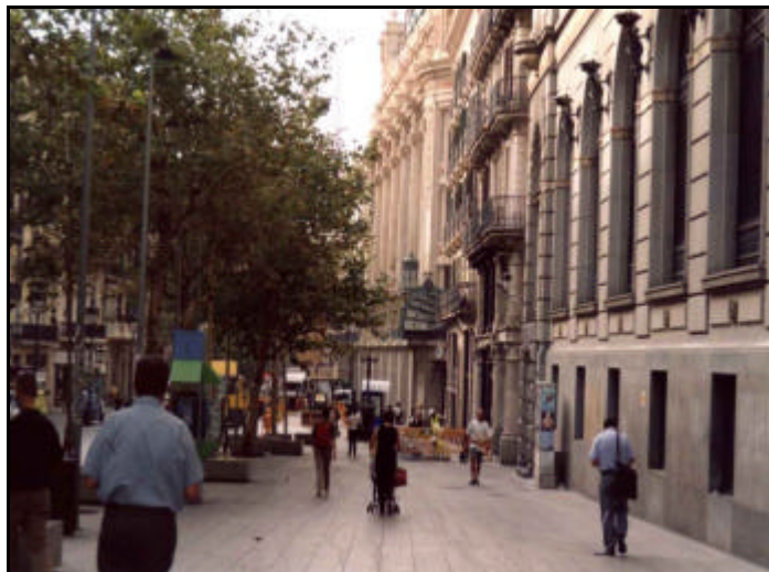
Foto 1: Vista general de l'Avinguda del Portal de l'Àngel per la banda del carrer en sentit Llobregat, on es va excavar la Rasa 1.