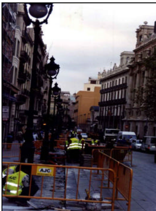
Foto 35: Vista general del segon tram de la Rasa 2, durant el repicat del paviment.