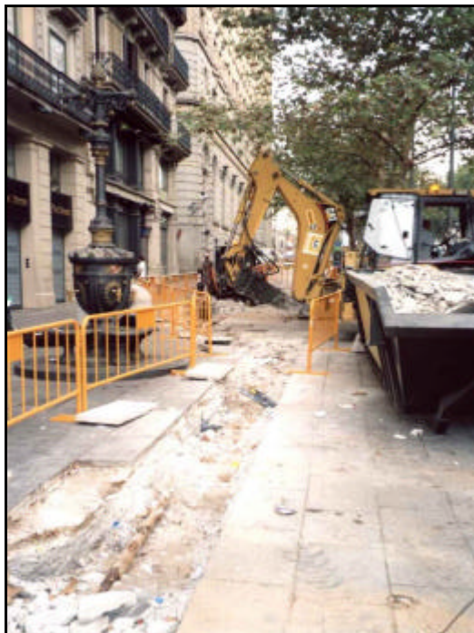
Foto 5: Excavació de la Rasa 1 en el segon tram situat entre el carrer Santa Anna i el final de l'edifici del “Banco de España”.