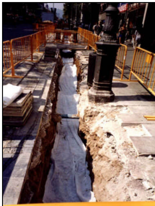
Foto 33: Vista general del primer tram de la Rasa 2, una vegada excavades les estructures i cobertes amb geotèxtil.