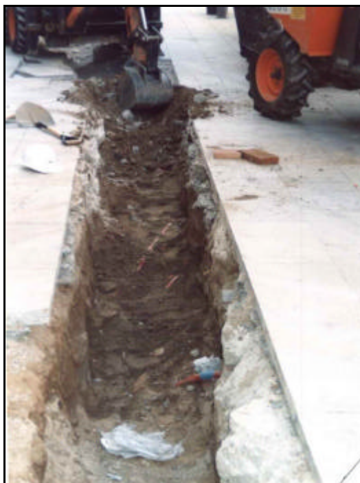
Foto 3: Excavació de l'estrat de runa i sauló, UE 101, situada immediatament per sota del paviment de la Rasa 1.