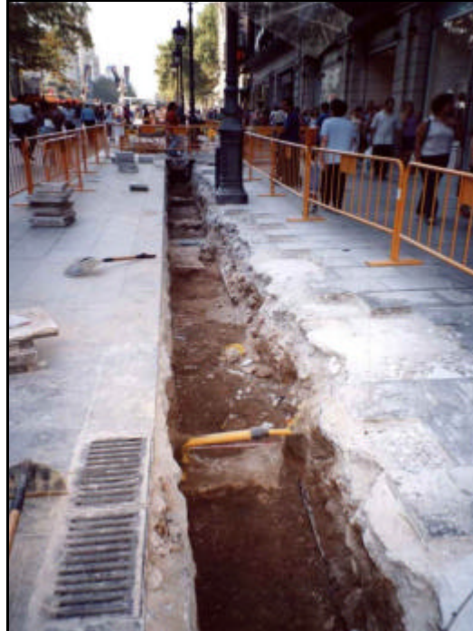
Foto 27: Vista general de la Rasa 2. En primer terme detall del mur UE 224.