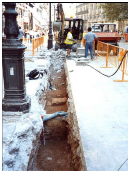
Foto 18: Tram de la Rasa 2 on ha aparegut (en primer pla i mirant en direcció a mar) el mur UE 209. S'aprecia el mur UE 213 al fons.