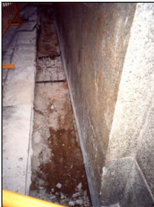
Foto 7: Excavació de la Rasa 1 en el quart tram situat en un carreró sense sortida paral·lel al carrer Santa Anna i situat al final de l'edifici del “Banco de España”. En aquesta zona es localitzava la subestació de la companyia FECSA ENDESA.