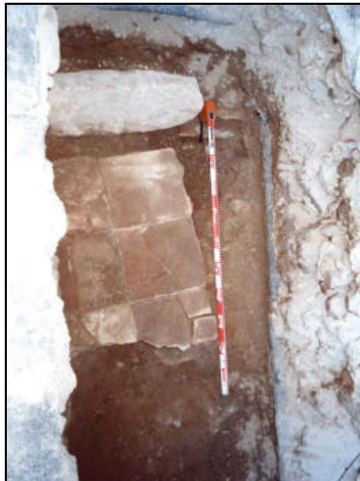
Foto 24: Detall del paviment UE 220 i de la llosa que li fa de límit, UE 223.