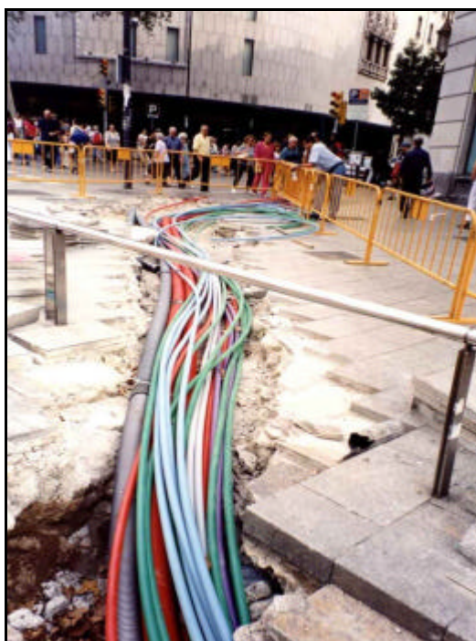
Foto 37: Vista general del tercer tram de la Rasa 2, situat a tocar del C/ Fontanella i davant l'edifici de telefònica. Estesa de serveis per damunt de la llosa de formigó.