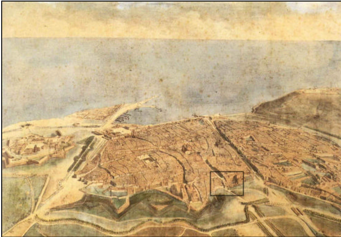
Vista de Barcelona a vol d'ocell, del 1860, d'Onofre Alsamora. Dins del recuadre s'aprecia el grup de cases situades al final de l'Avinguda Portal de l'Àngel i que foren destruïdes entre 1871 i 1885 i de les quals se n'han trobat les restes.