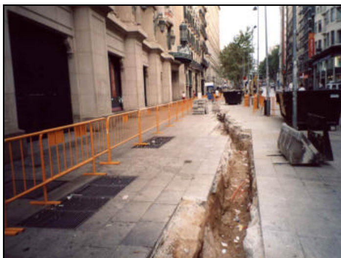
Foto 4: Excavació de la Rasa 1 en el primer tram situat davant l'edifici de "El Corte Inglés".