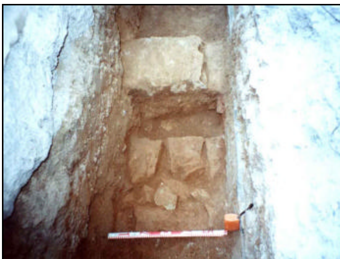
Foto 20: Detall del mur UE 214 (en primer pla) i darrera seu, el mur UE 213.