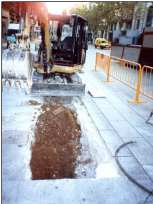
Foto 11: Vista general de l'Avinguda Portal de l'Àngel en el moment en que es comença a obrir la Rasa 2.