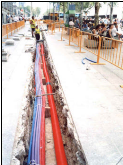
Foto 9: Estesa dels serveis de cablejat i electricitat, una vegada excavada la rasa, a l'altura de l'edifici del "Banco de España".