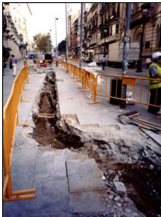
Foto 8: Excavació de la Rasa 1 en el cinquè tram, des del final de l'edifici del “Corte Inglés” fins a l'altura del “Cine París”.