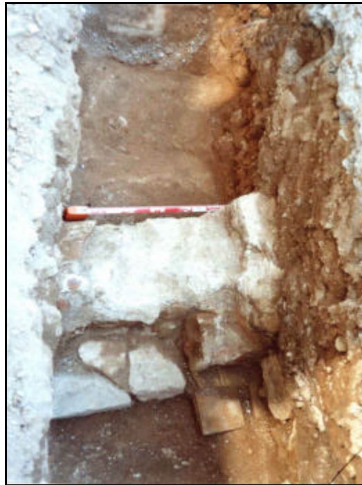
Foto 13: Detall del mur UE 205, el paviment de terra batuda UE 206 i el paviment UE 207.