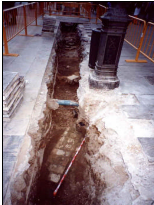
Foto 32: Detall de la claveguera UE 233 i UE 234 dins de la Rasa 2.