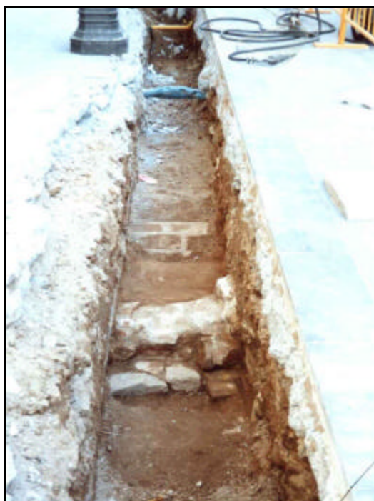
Foto 12: Vista general del tram de la Rasa 2 on va aparèixer el mur UE 205, el paviment de terra batuda UE 206 i el paviment UE 207.